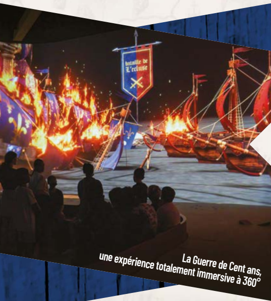
La Guerre de Cent ans, une expérience totalement immersive à 360°

La commune d'Angles-sur-l'Anglin, labellisée « Plus Beaux Villages de France® », vous charmera par ses jolis paysages bucoliques, sa forteresse médiévale et le Centre d'Interprétation du Roc-aux-Sorciers où est présentée la reconstitution d'une frise sculptée préhistorique.