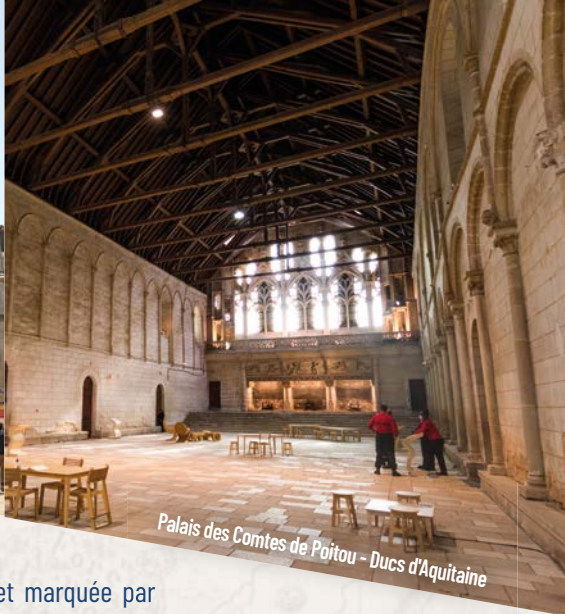
Palais des Comtes de Poitou - Ducs d'Aquitaine