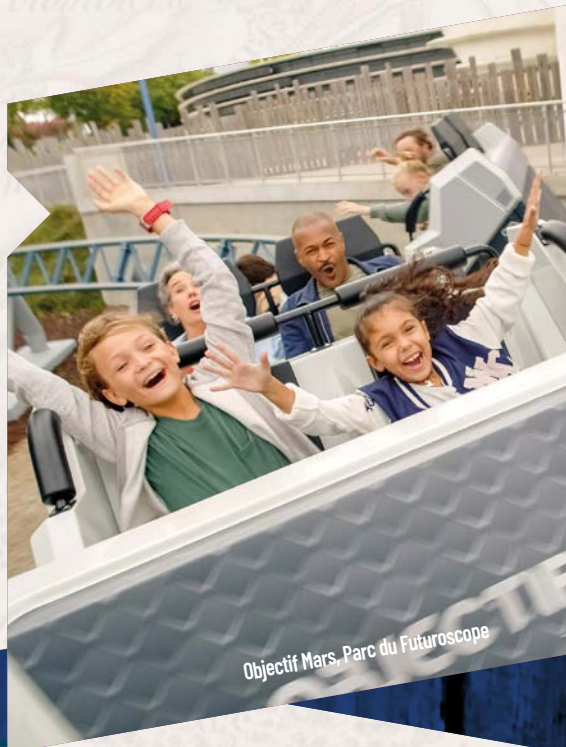
Objectif Mars, Parc du Futuroscope

Au Futuroscope , 40 attractions immersives attiseront votre curiosité. Plongez au cœur d'une tornade avec Chasseurs de Tornades, élue meilleure attraction au monde, et devenez astronaute avec Objectif Mars. Soyez étonné par Éclipse, nouveau show technologique, et son duo d'un bras robot géant et d'un performer. Rêvez devant le Spectacle Nocturne : La Clé des Songes. Prolongez votre visite au Futuroscope en vivant une expérience unique en France à l'Aquascope, parc aqua-ludique qui ouvre ses portes en juillet 2024 et qui propose une alliance inédite entre l'eau et le numérique.