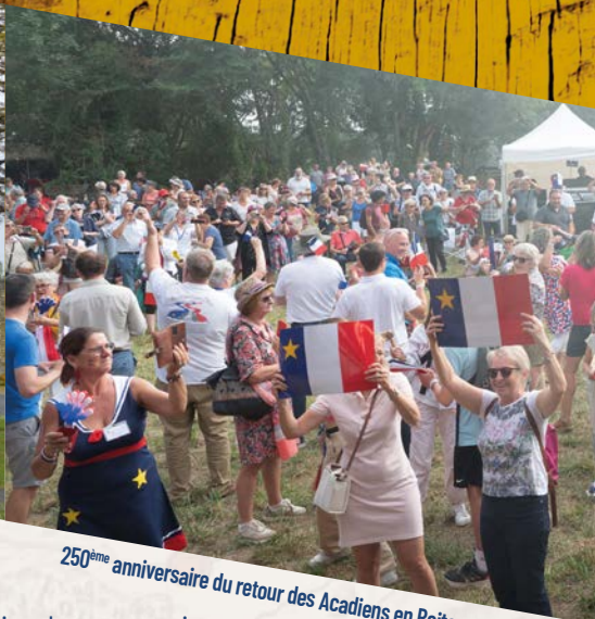
250 ème anniversaire du retour des Acadiens en Poitou