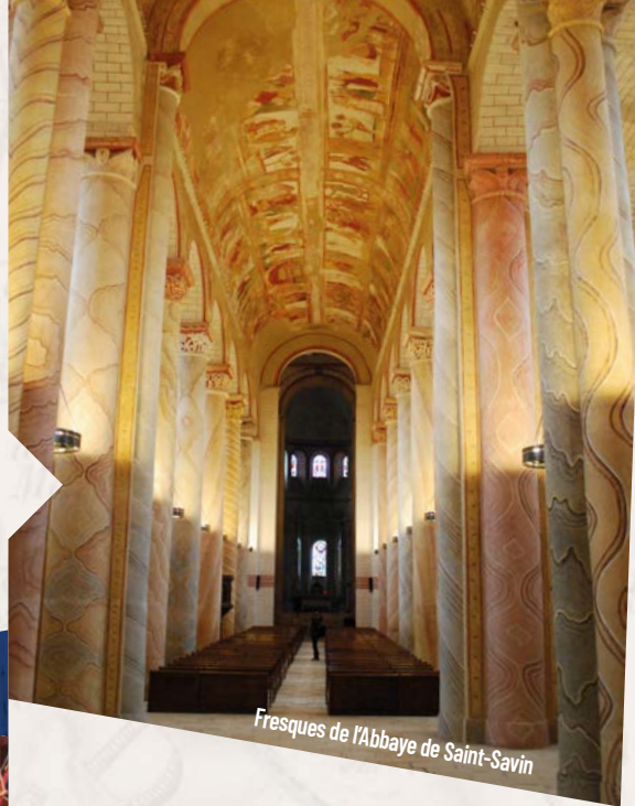
Fresques de l'Abbaye de Saint-Savin

L'Abbaye de Saint-Savin, surnommée la « Sixtine romane », vous fait replonger au Moyen Âge. L'église, avec ses peintures murales uniques au monde, a fêté les 40 ans de son inscription au patrimoine mondial de l'UNESCO en 2023.