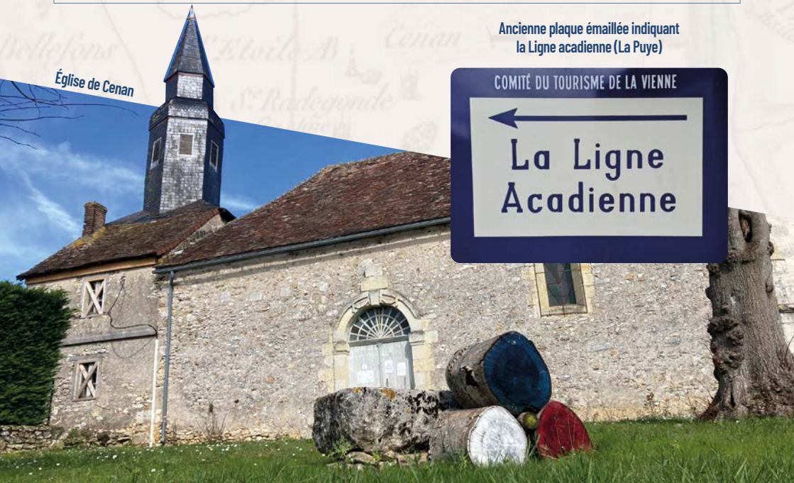
Église de Cenau