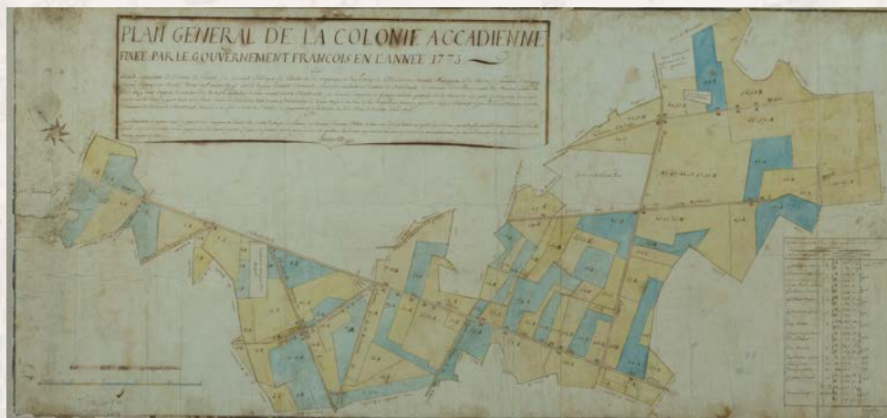
Plan général de la colonie Acadienne en 1773

Bien qu'éphémère, le passage des Acadiens dans la Vienne reste dans les mémoires et son souvenir se perpétue. En effet, 38 des 57 maisons construites au XVIII e siècle subsistent le long de ce que l'on appelle aujourd'hui la « Ligne acadienne ».