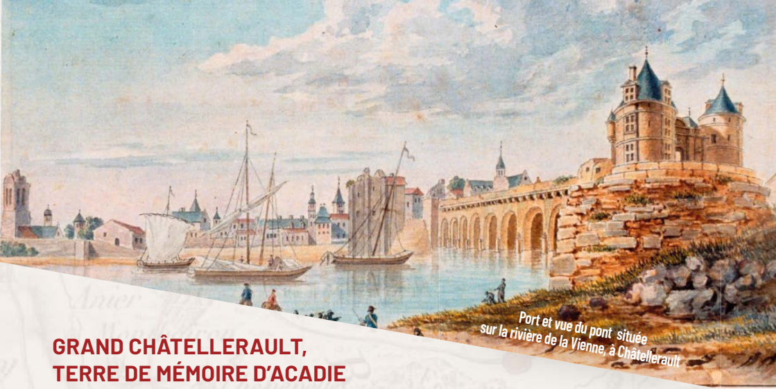
Port et vue du pont située sur la rivière de la Vienne, à Châtelleraut