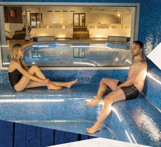
Spa Source, La Roche-Posay