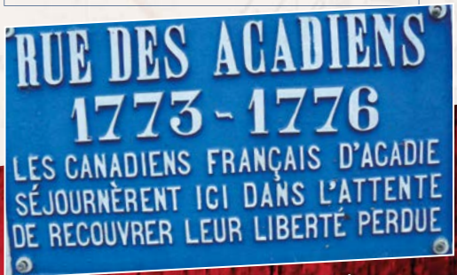
Plaque installée en 1936 à Châtelleraut

Association Châtelleraut-Québec Acadie Alain BOURREAU 📍 8 rue de la Taupanne 86100 Châtelleraut ☎️ +33 6 03 28 43 20