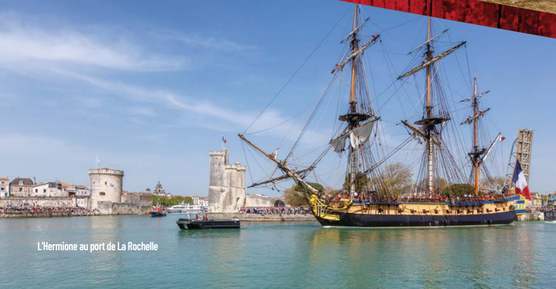
L'Hermione au port de La Rochelle