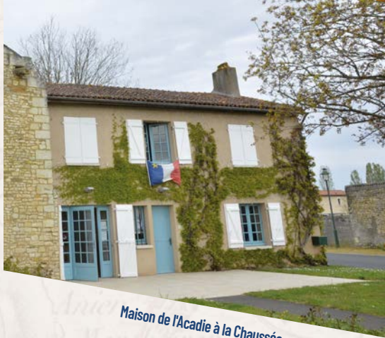
Maison de l'Acadie à la Chaussée